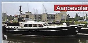
Van der Valk Trawler 16.00 AK Smits Jachtmakelaardij € 139.000,-