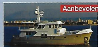
Farmont 70 Long Range Explorer Elburg Yachting € 1.250.000,-